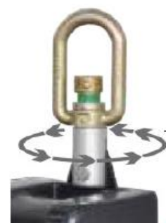
Testigo de caída