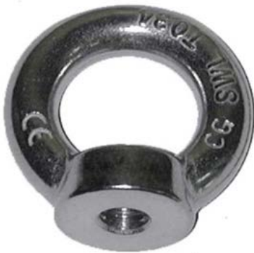
CMU Carga máxima de utilización