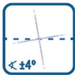
MODO DE AUTONIVELACIÓN SELF-LEVELING