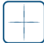
PROYECCIÓN CRUZADA CROSS-LINE