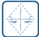
ÁNGULO DE LÍNEA LINE ANGLE