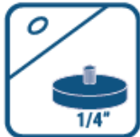
SALIDA PARA TRÍPODE TRIPOD MOUNT