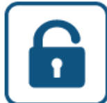
SISTEMA DE BLOQUEO DE AUTONIVELACIÓN SELF-LEVELING SYSTEM LOCK