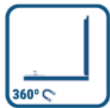
SOPORTE MAGNÉTICO MAGNETIC HOLDER

Nivel láser autonivelante de líneas cruzadas. Es ideal para realizar mediciones tanto en interior y exterior. Dispone de modos manual y autonivelación. Este nivel láser se entrega en un kit que consta de un nivel láser, una base pivotante magnética, y una bolsa portátil.