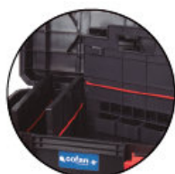
Portaherramientas Porte-outils Tool holder Prateleira de ferramentas