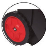
Ruedas en PP Roues en PP PP wheels Rodas em PP