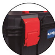
Cierres ABS Fermetures en ABS ABS latches Fechos em ABS