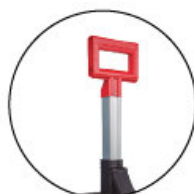
Asa telescópica Poignée télescopique Telescopic handle Alça telescópica

Material: PP Polipropileno + Cierres de ABS